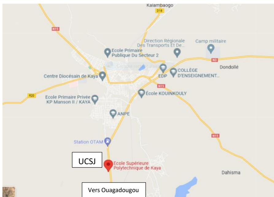
Carte 1 : Situation géographique de l'UCSJ, dans la ville de Kaya

L'UCSJ est située sur la route nationale n° 3, à l'entrée de la ville de Kaya, sur la gauche (figure 1). Kaya, chef-lieu de la Région du Centre-Nord est à une centaine de kilomètres de la ville de Ouagadougou, capitale du Burkina Faso.